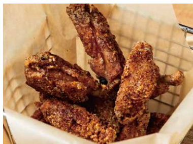
スパイシーチキンフリット