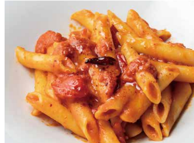
ペネアラビアータ