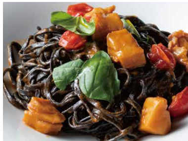
イカスミを練り込んだタリオリーニ 紋甲イカとフレッシュトマト