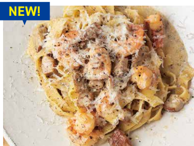
天然海老とポルチーニ茸の クリームソース タリアテッレ