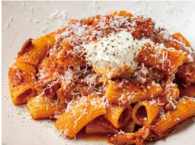
豚肉のナポリ風ラグーソース リガトーニ

アオナボシェフ甲斐が自信をもってお届けするパスタ 多種多様のパスタをぜひお召し上がりください