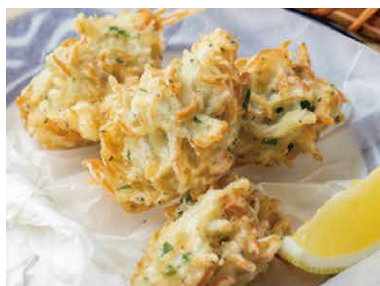
釜揚げシラスと あおさ海苔のフリッテッレ