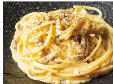
優味豚パンチェッタの カルボナーラスパゲッティ