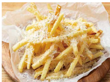
カーチョ エ ペペ ポテトフリット