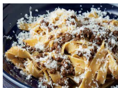
和牛のボロネーゼ タリアテッレ